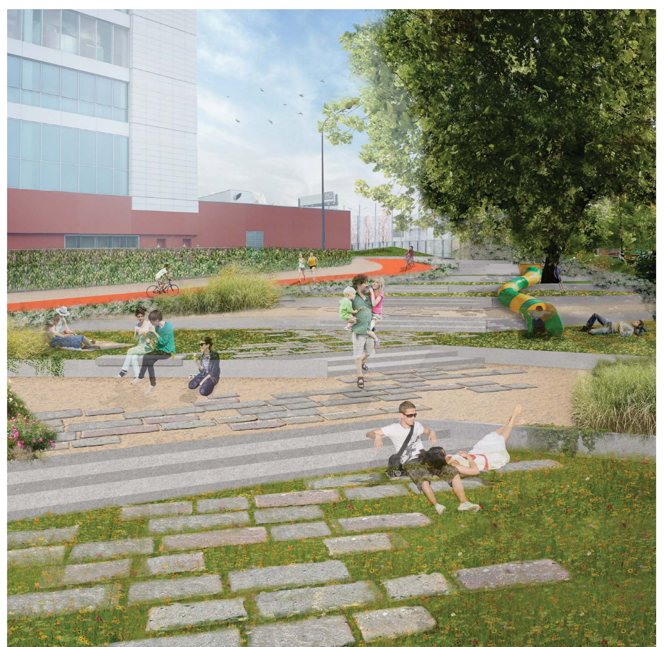
I NUOVI TERRAZZAMENTI DI ACCESSO AL CAVALCAVIA (lato Isola)